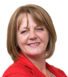
Jocelyn Davies (Cadeirydd) Dwyrain De Cymru Plaid Cymru